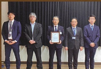
▲北陸電力小松子チーム

企業・団体は5名1チームで、団体受験に申込可能です。昨年は「北陸電力小松子チーム」が合格率、総合得点で団体受験1位に輝きました。今年も上位3位まで表彰予定です。1位は会報誌で紹介します。